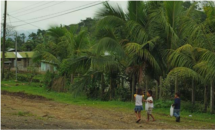
buitenwijk Aguas Zarcas